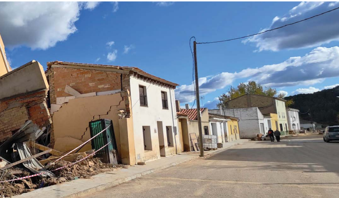
Daños de la crecida del Magro a su paso por Hortunas. J. Sierra

indestructible olla se ha convertido en un icono de la tragedia ¿De quién era esa olla? ¿Quizá de una víctima a la que sorprendió la riada? ¿Imaginan la fuerza y violencia con la que llegó el agua a las barriadas utielanas situadas junto al río?