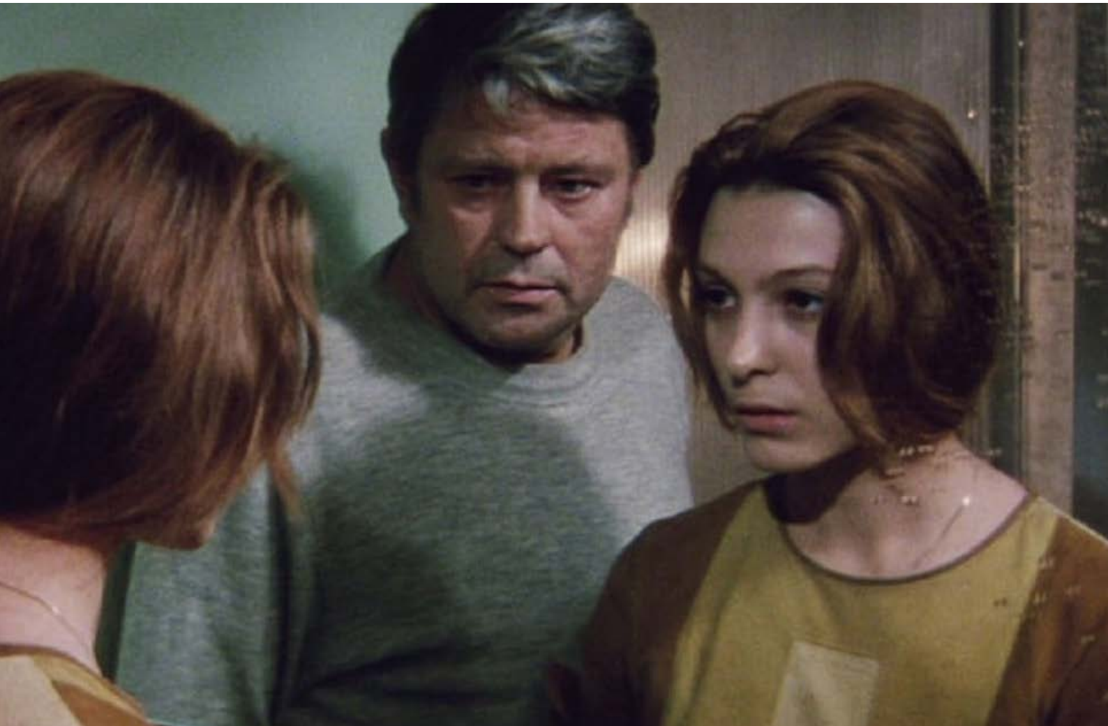
Fotograma de la película Solaris de 1972.

Stanislaw Lem ya había sido adaptado por el cineasta checo Jindřich Polák. A bordo de la nave Ikarie XB 1 (1966), sus protagonistas viajarán muy conscientes del coste que supone rebasar el sistema solar. Vivir allí 28 meses equivale a 15 años en la Tierra. “Cuando vuelvas –dice por videollamada la esposa de un cosmonauta a su marido– me encontrarás vieja y no te gustaré ”. El problema metafísico de nuestra relación con el tiempo vuelve a resonar en Solaris , un planeta iluminado por dos soles que se tiñe de sombras cuando actúa un océano que lo cubre parcialmente y que hurga en la mente de los cosmonautas extrayendo sus fantasmas. Y Kris Kelvin, ignorante de todo ello, tendrá como misión