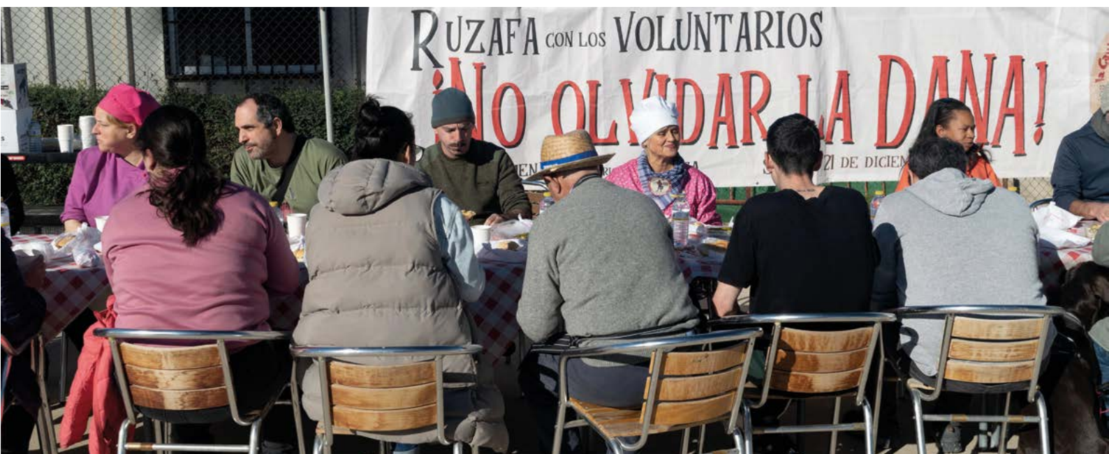
Comida del voluntariado del barrio de Ruzafa.

Hay ríos en el cielo es el título del último libro recientemente publicado de la reputada escritora Elif Shafak. Cuando la Asociación de Amigos de la Nau Gran me invitó a escribir un breve texto a propósito de la tragedia provocada por la DANA en Valencia, a finales de octubre de 2024, estaba leyendo sus páginas, que se remontan a la antigua Mesopotamia y alcanzan nuestros días en un relato fascinante. El hilo conductor es el poder, material y simbólico, del agua en nuestra cultura. Habitamos un planeta de agua, más del 70% de su superficie está compuesta de agua y nuestro cuerpo también se compone de agua en más de un 50%. Pero con frecuencia lo olvidamos.