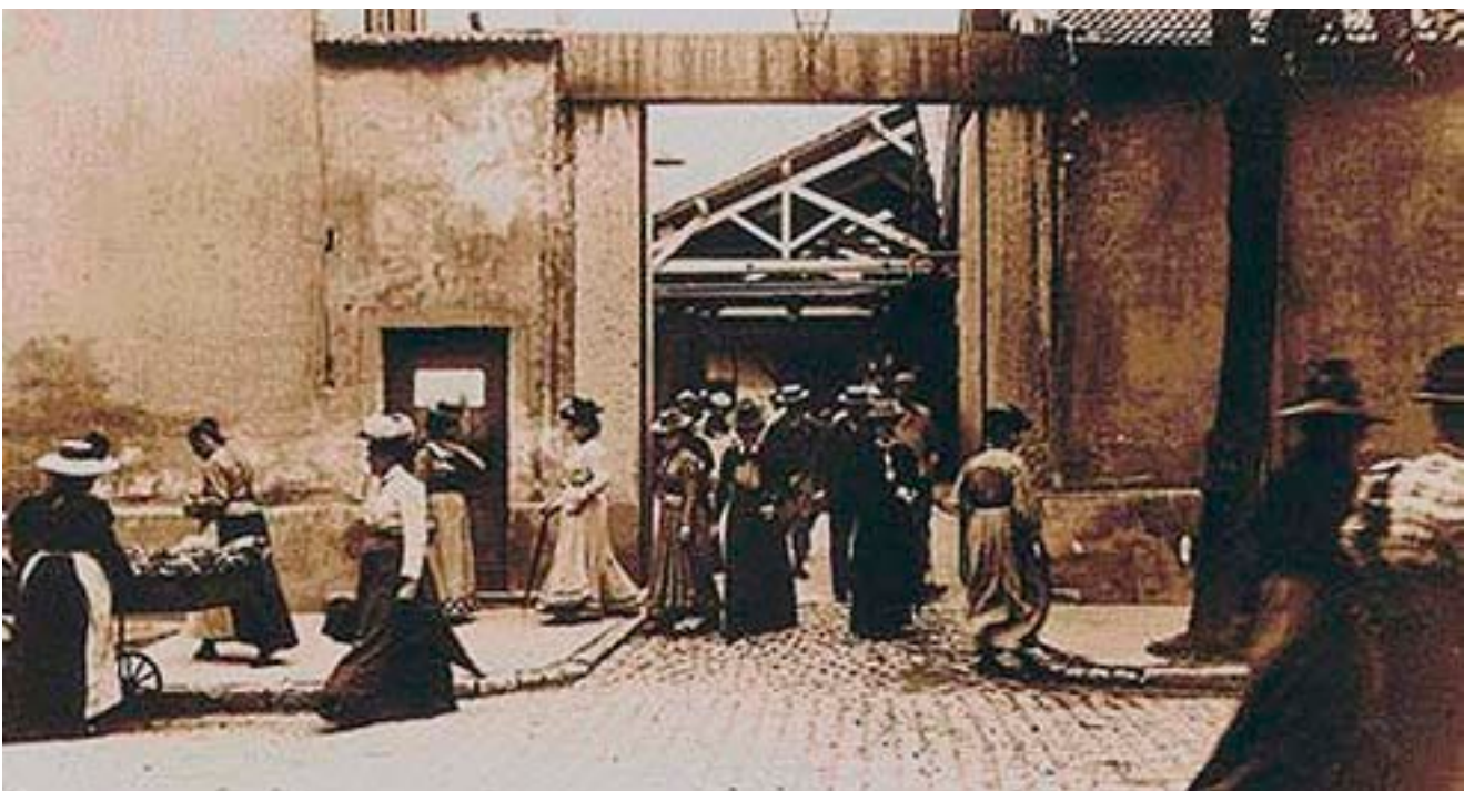
Los hermanos Lumière en su primer filme llevaron la publicidad a la fotografía en movimiento al publicitar su fábrica